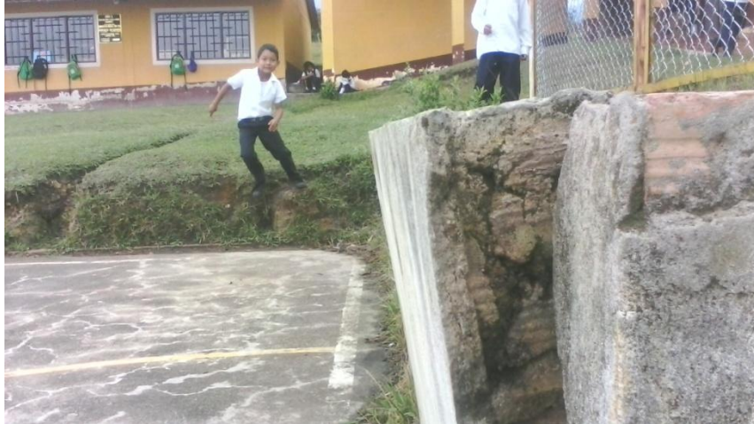
DETERIORO POR ACCION DE LA NATURALEZA EN LA SEDE SAN MIGUEL