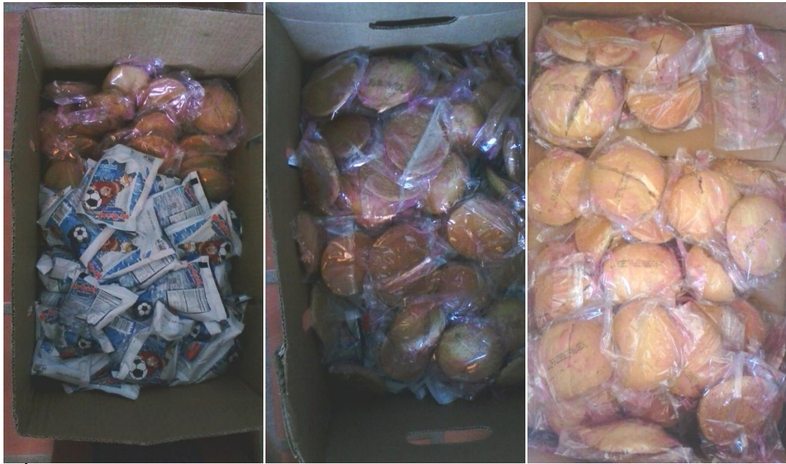
IMÁGENES DETALLE DE LOS REFRIGERIOS INDUSTRIALIZADOS ENTREGADOS A LOS ESTUDIANTES.