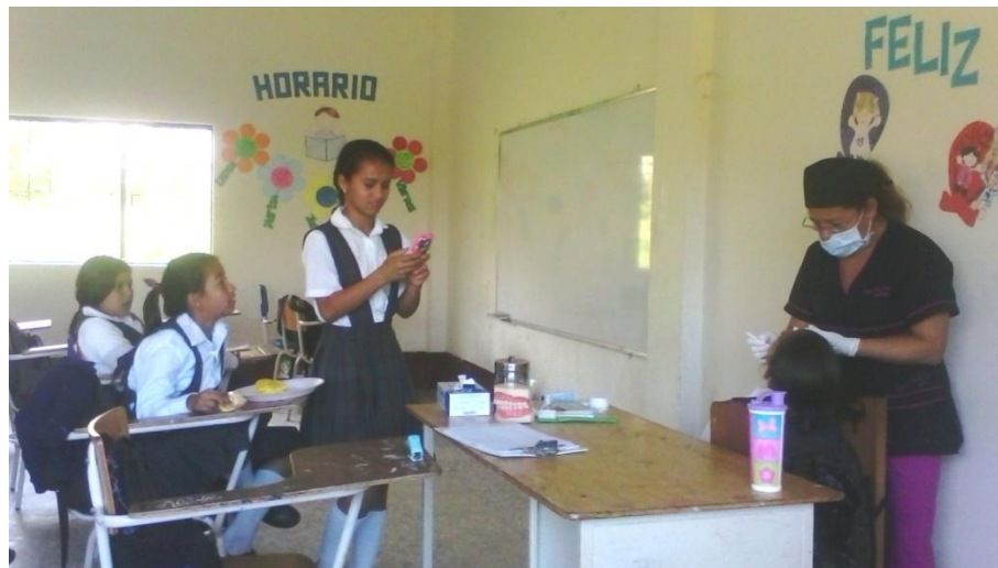
JORNADA DE SALUD ORAL (SE REALIZO EN TODAS LAS SEDES)