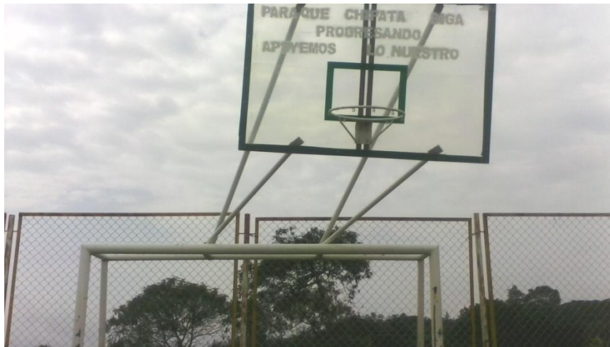
DETERIORO POR ACCIÓN DE OS VANDALOS EN LA SEDE SAN MIGUEL