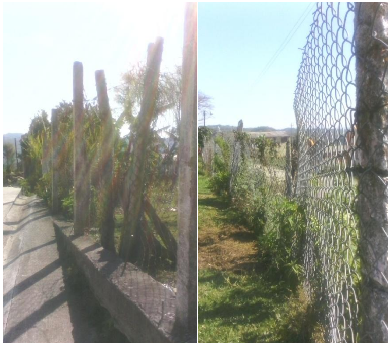
ESTADO DEL ENCERRAMIENTO EN LA SEDE PUENTE GRANDE