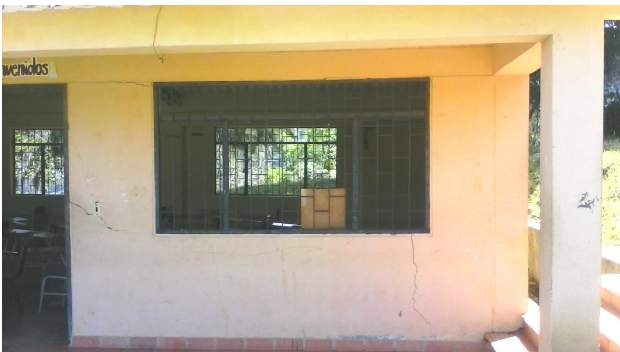
EVIDENCIA DEL ESTADO DE DETERIORO DE LA INFRAESTRUCTURA DE LA SEDE PRINCIPAL