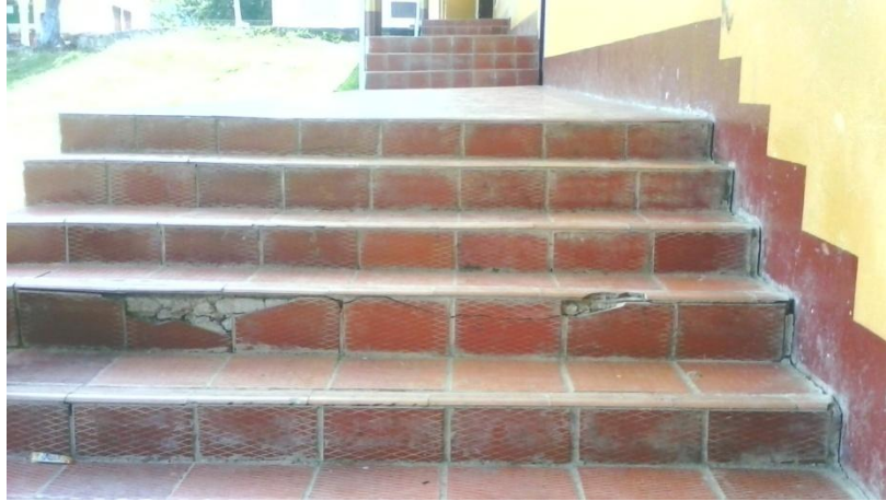
DETERIORO POR LEVANTAMIENTO DE LOS CORREDORES Y SEPARACIÓN DE LA ESTRUCTURA.