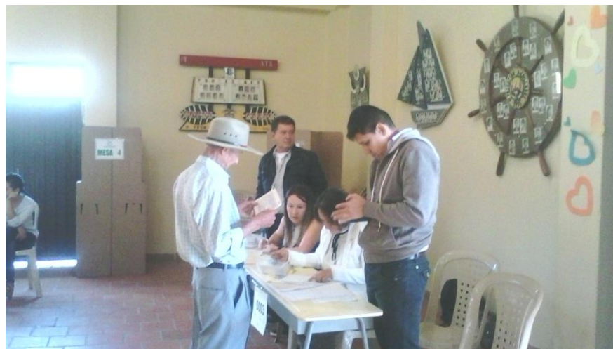
JORNADA DEL PLEBISCITO, SEDE PRINCIPAL ITA AGATÁ