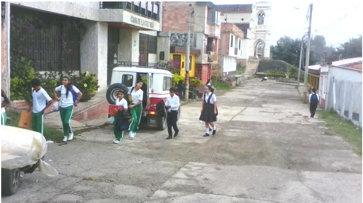
IMÁGENES DE DOS DE LOS DIEZ VEHÍCULOS CONTRATADOS POR LA ADMINISTRACIÓN MUNICIPAL, PARA EL TRANSPORTE ESCOLAR.