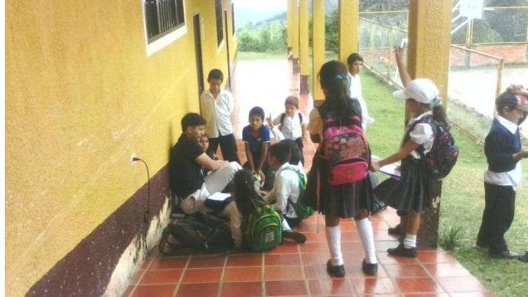
IMAGEN DE LA ÚNICA VISITA DEL TUTOR DEL PROYECTO FRACTUS A SAN MIGUEL