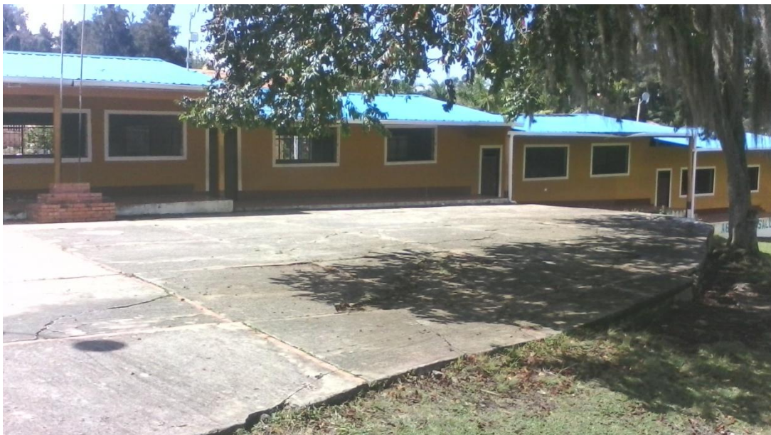
ESTADO DE DETERIORO POR LEVANTAMIENTO Y DESLIZAMIENTO DEL TERRENO