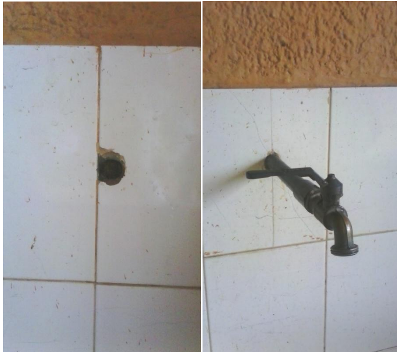
IMÁGENES DE LAS UNIDADES SANITARIAS DE LA SEDE SAN MIGUEL