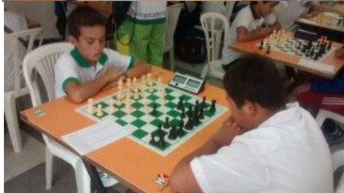
IMÁGENES DE LA FINAL DEPARTAMENTAL DE AJEDREZ (SUPERATE 2016)