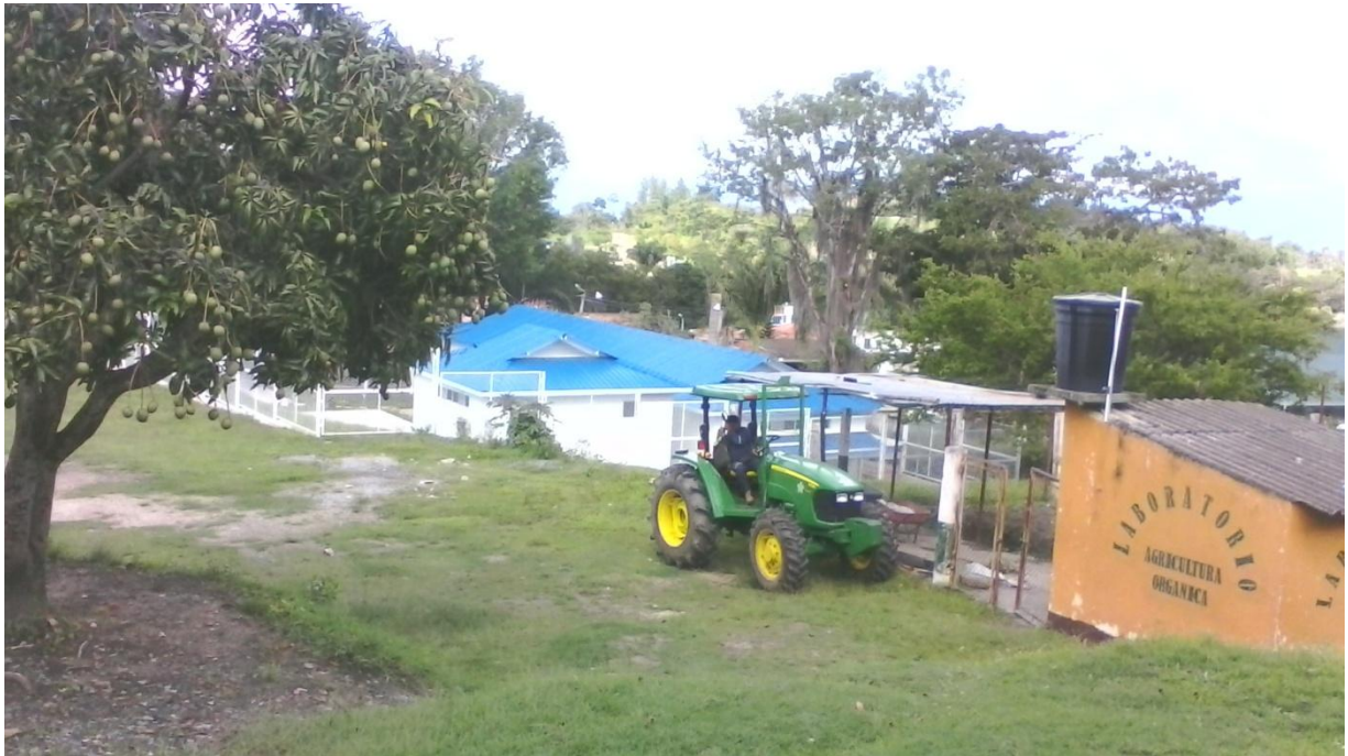
TRACTOR DESTINADO POR EL SENA PARA LA ARTICULACIÓN EN LAS PRACTICAS AGRICOLAS.