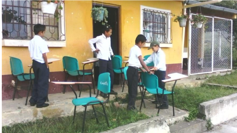
ENTREGA DE PUPITRES DONADOS OR COOPSERVIVELEZ A LAS SEDES RURALES.