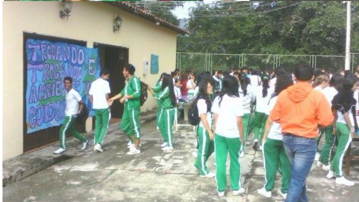
Jornada ecológica trocando trocando, el medio ambiente vamos cuidando.