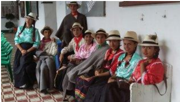
PARTICIPANTES EN FESTIVAL FOLCLORICO ESTUDIANTIL DE VELEZ SANTANDER.